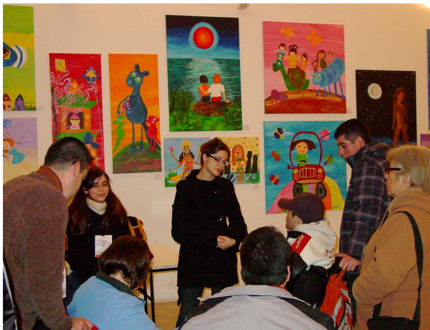
Exposición de pintura realizadas por niños de Teletón.