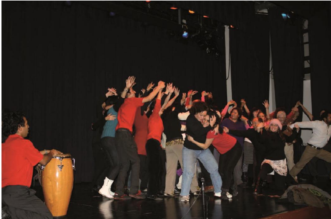
Compañía de Teatro Espontáneo Transhumante y público participante.