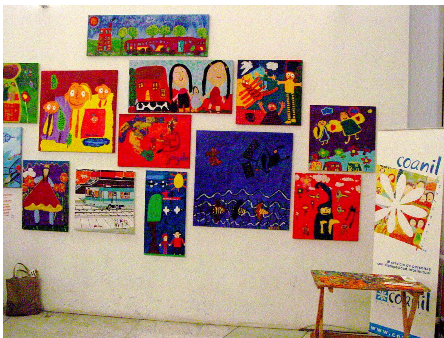
Exposición de pintura realizada por niños de Coanil.