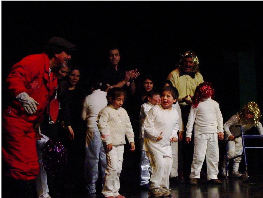
Compañía de Teatro infantil “Los Laureles” de Coanil. Pieza teatral “La Locomotora”