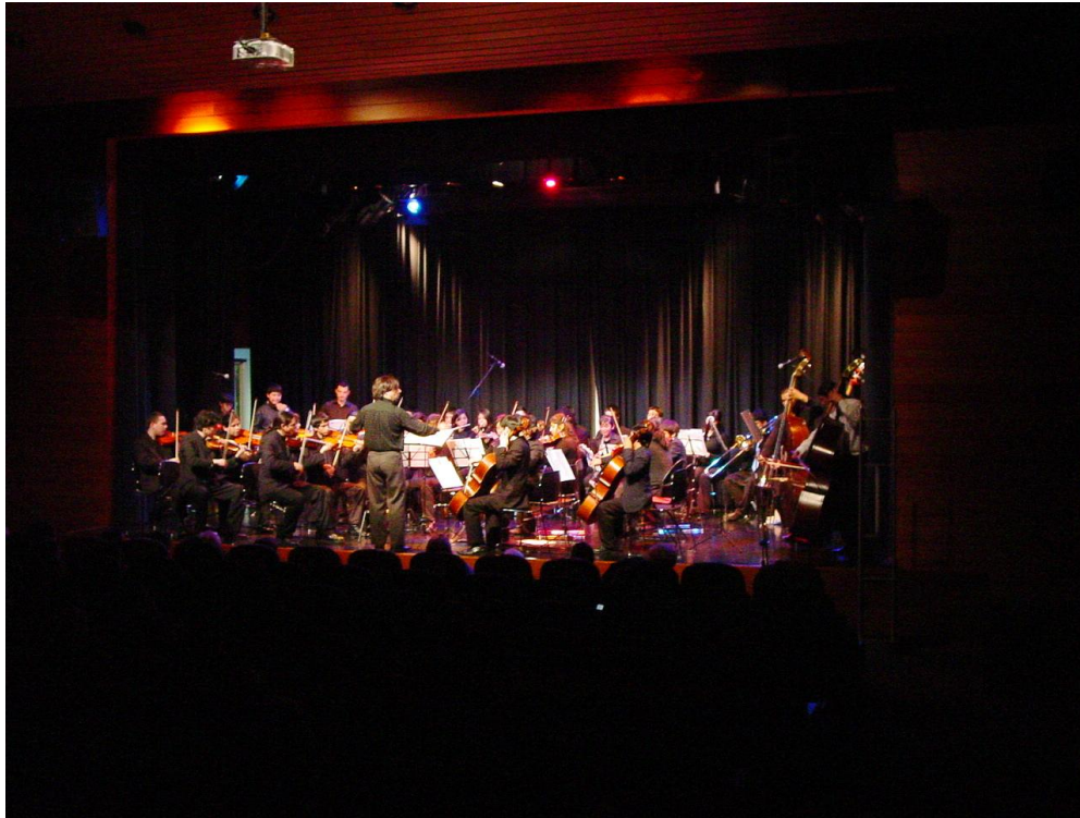
Orquesta Juvenil de Talagante

Durante el desarrollo del evento, el ambiente vivido fue de intercambio, discusión y enriquecimiento mutuo. Así lo demostró el acto de cierre marcado por la espontaneidad del baile y la música junto a la Orquesta Juvenil de Talagante y la Compañía de Teatro Espontáneo Transhumante, quienes propiciaron un ambiente de alegría y creatividad conjunta.