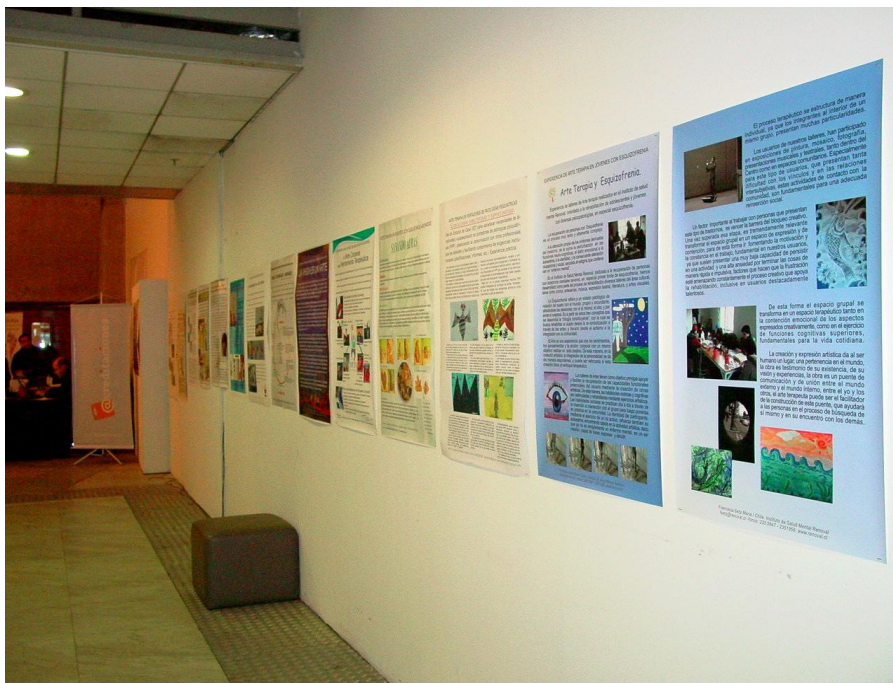
Exhibición de Posters

Dentro de las actividades complementarias del II Congreso de Arte Terapia Latinoamericano, en el Hall Central se contó con la exhibición de Posters seleccionados de diversos Arte Terapeutas, dando a conocer sus experiencias y diferentes campos de intervención. En este mismo espacio, convergieron exposiciones de pintura de realizadas por niños de Teletón, Coanil, Crie y Célula Roja entre otros; Fundaciones dedicadas a la rehabilitación de niños y jóvenes con Necesidades Especiales. Junto a ello, la compañía de Teatro infantil “Los Laureles” de Coanil, presentó la pieza teatral “La Locomotora”, presentación realizada especialmente para el Congreso. También presenciamos algunas Performances realizadas de forma espontánea por participantes del Congreso. Además se contó con stands de ventas de libros especializados relacionados con las temáticas del Congreso.