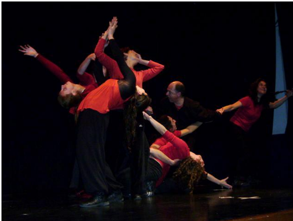
Compañía de Teatro Espontáneo Transhumante.